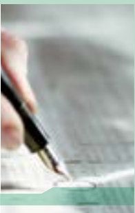
Tätigkeitsberichte des Vorstands für 2022