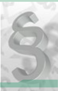
Bericht aus dem Versorgungswerk