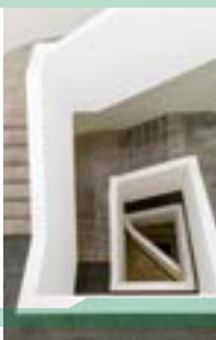
Netzwerk Best Practice Ausbildung