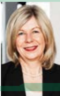
Editorial der Präsidentin