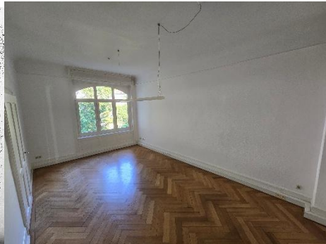
zu vermietendes Zimmer